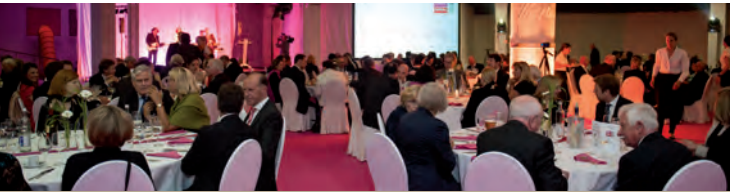
Empfang im »Gaswerk Augsburg«