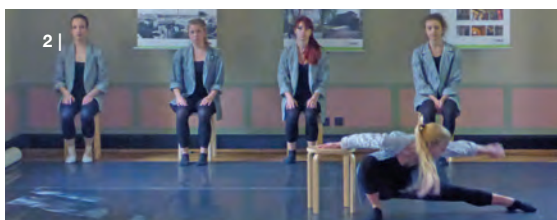
1 | Villa Haag 2 | Ballett des Tanzzentrums Otevřel-Záboj

WIR BEDANKEN UNS FÜR DIE FREUNDLICHE UNTERSTÜTZUNG BEI