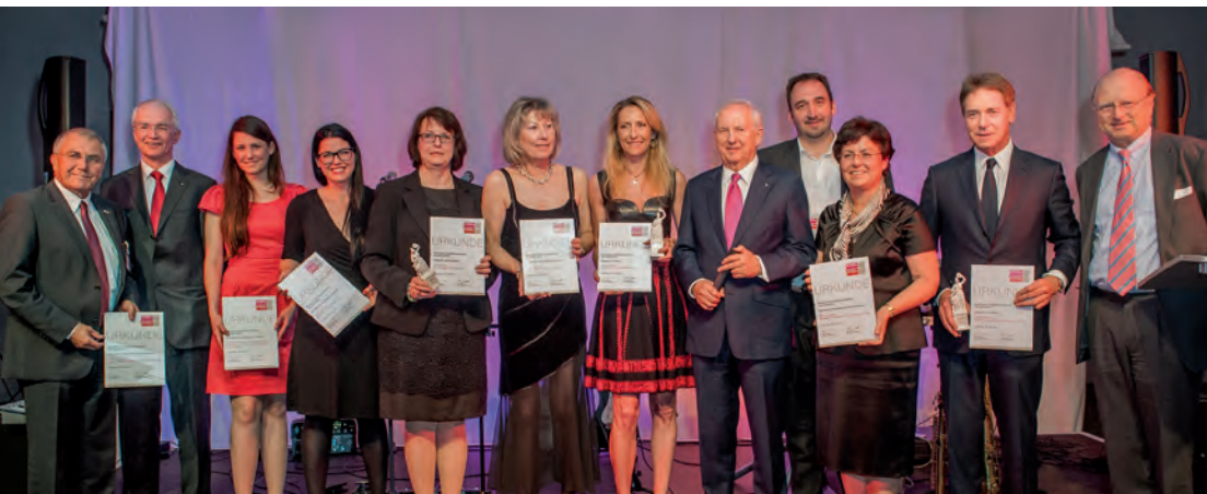
Gruppenbild mit allen Preisträgern und Nominierten